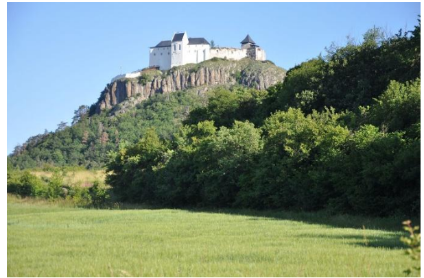
A képeken: Füzér vára 2014-ben (balra) és 2016-ban (jobbra)