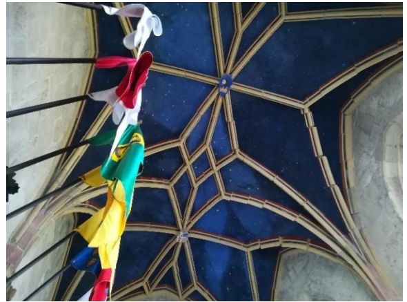
A képeken: a felújított várkápolna oltára (balra) és csillaghálós mennyezete (jobbra)