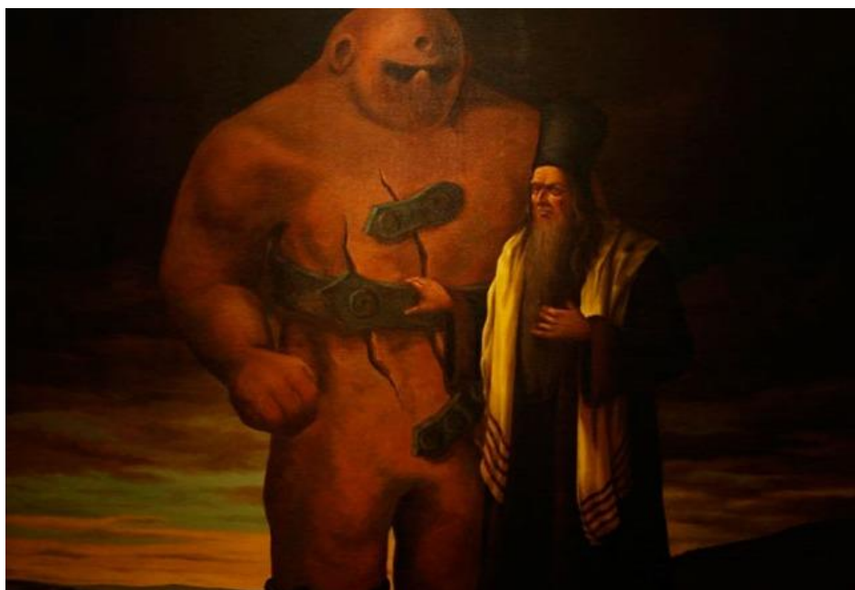
Löw rabbi és a prágai Gólem

Nézzünk meg egy térben közelebbi példát is, a szomszédunkból származó prágai Gólem legendáját. A történet az 1500-as években keletkezett, az agyagszörny születése Judah Löw ben Bezalel rabbi nevéhez köthető. A rabbi a zsidók üldözésére, népének szenvedéseire válaszul keltette életre a szörnyeteget a titkos tanok forrása, a Kabbala segítségével. A legenda szerint a gólem teste a Moldva folyó agyagjából gyúródott, majd egy varázserejű papíros, a sém segítségével a rabbi életre keltette. A gólem hűségesen követte a rabbi utasításait, védelmezte a zsidókat az ellenük elkövetett erőszaktól, és igazságot tett ott, ahol szükség volt rá. A szörnyeteg azonban egy idő után elszabadult, és fenyegetni kezdte az egész várost, beleértve a zsidókat is. A rabbi így kivette a gólem szájából a sémét, ezzel a szörnyeteg ismét élettelen agyagszoborrá változott. Bizonyos nézetek szerint a prágai gólem az isteni segítséget jelképezi.