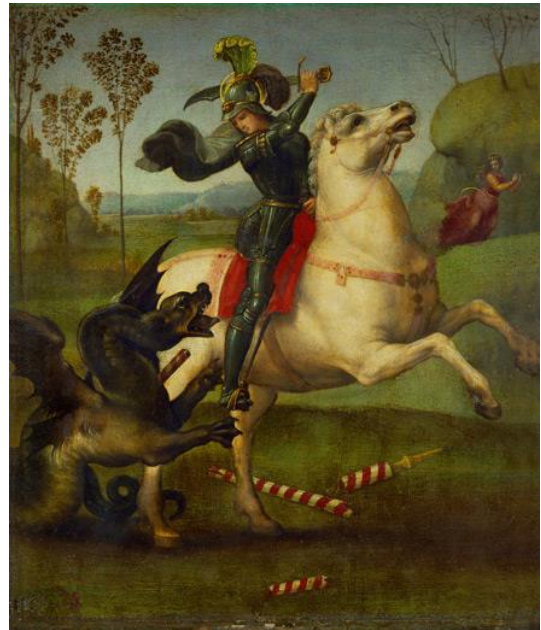
György és a sárkány (kardos ábrázolás)