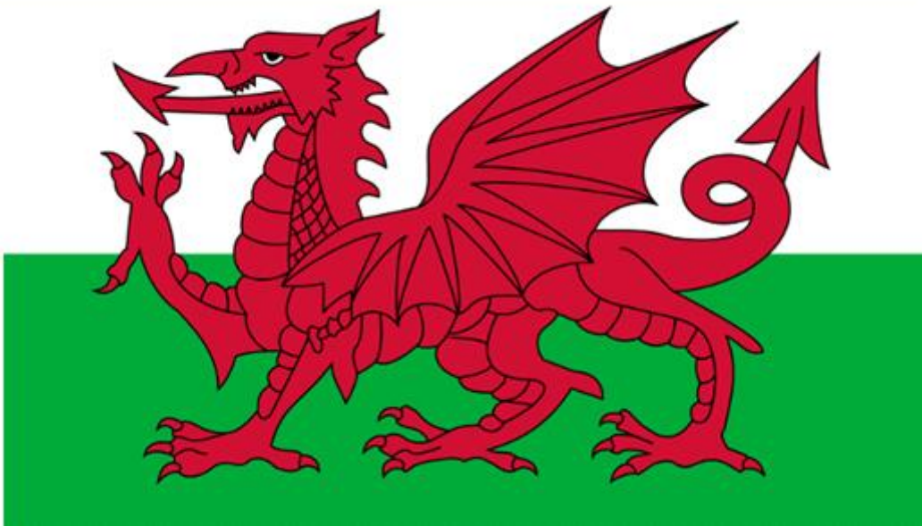
Kép a Wales-i zászlóról

A mondabeli állatok a meséken kívül megannyi művészeti alkotásban megjelennek: szobrok, festmények, dalok írják le a sárkányok és társaik különféle alakjait, és a hozzájuk köthető történeteket. Ezen állatok a heraldikában is megjelennek: számos címer hordoz magán kitalált lényeket, s ezeknek különféle jelentést társít. A sárkány a heraldikában például a kincsek őrzője, a bátorságot jelképezi, az egyszarvú úgyszint a bátorság, továbbá az erő és az erény szimbóluma. Igen gyakran használt fantázialény a griff is, a sas fejű, oroslán testű bestia. A címereken való elhelyezkedésüknek szintén van jelentősége; nem mindegy, hogy ülő, ágaskodó, vagy éppen lépő képet választunk, illetve az is számít, hogy a lény a címerünkön melyik irányba néz.