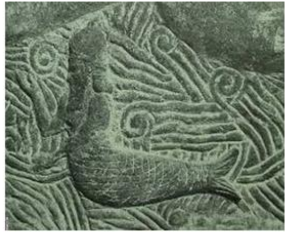
EA két ábrázolása

A vallás fejlődése során a vízistenek képe más istenekével is összemosódott, ábrázolásukat több különféle állat egyes részeivel toldották meg. A sólyom, sas, gazella, oroszlán, kígyó, a hal, és a krokodil mind megtalálható valahol ezekben az istenségekben, s ezek mind a víz életet adó, és egyben romboló erejét személyesítik meg. A fenti állatokat azon tulajdonságaik szerint kombinálták, amelyiket az adott istenségnek hangsúlyozni akarták. A sárkány egyik legősibb ismert ábrázolása szintén Babilónia területéről, az ősi Sumér földről maradt fent. Ezen ábrázolás szerint a sárkány elől sólyom, hátul oroszlán testű állat. Ez a lény tekinthető a sárkány és a griffmadár közös őseinek, egyúttal a madárlábbal ábrázolt sárkányok is belőle származtathatók.