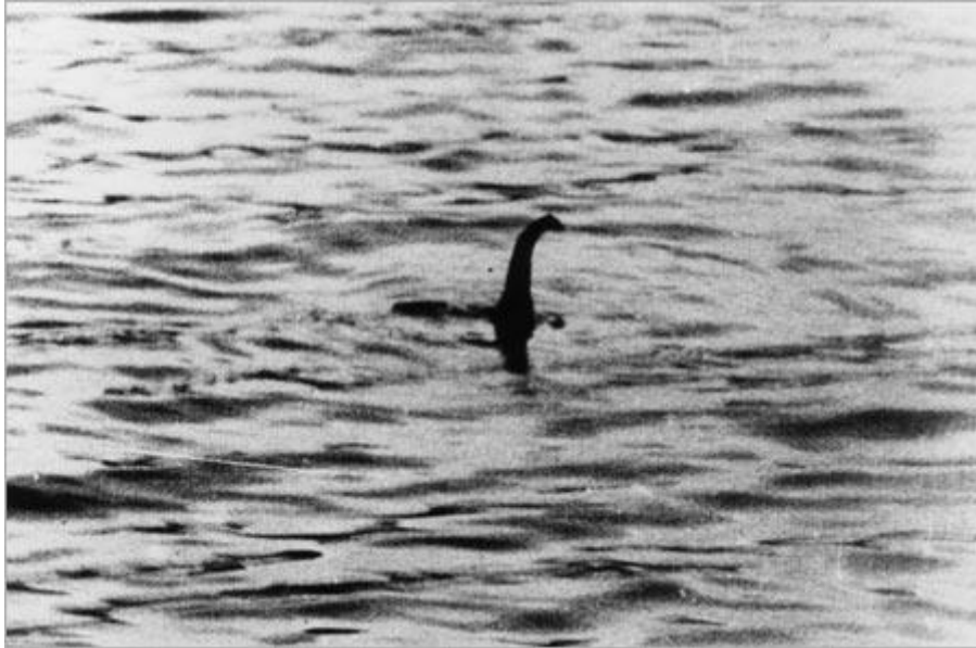
Az első kép a Loch Ness-i szörnyről

milyen hatalmassá nőheti ki magát, és mennyi feltételezés és magyarázat létezhet egy mondabeli lény eredetét illetően.