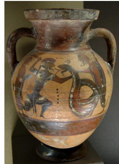
Kadmosz és a sárkány

Kígyó testű sárkányokkal Európában is találkozhatunk, ám itt sokkal elterjedtebb a másik alakjuk, a gyík-szerű testalkatú, hatalmas, szárnyas szörnyeteg. A régi ógörög mondákban ugyanazokat a sárkánytípusokat fedezhetjük fel, mint a mai mesékben. Ezek is több különféle állat részéből voltak összeházasítva. Sajnos az is igaz, hogy a legtöbb görög és római monda csak igen felületesen írja le a sárkányok külsejét, ha egyáltalán leírja azt. Kadmosz legendájában olvashatjuk, hogy miközben nővére Európé keresésére indult, kit Zeusz elrabolt, megölt egy sárkányt. Ezt a tettet számos képzőművészeti alkotáson (pl. cserépedényeken) is megörökítették, ám ezeken is viszonylag stilizált, vagy egyszerű ábrázolást kapunk ezekről a teremtményekről. Ellentétben kínai rokonaikkal, az európai sárkányok ezekben a történetekben inkább a gonosz megtestesítőiként vannak leírva. A továbbiakban megemlítek több olyan példát is, mely alátámasztja azt a következtetésemet, miszerint a kereszténység elterjedésével a sárkányok pozitív istenekből negatív szimbólumokká váltak.