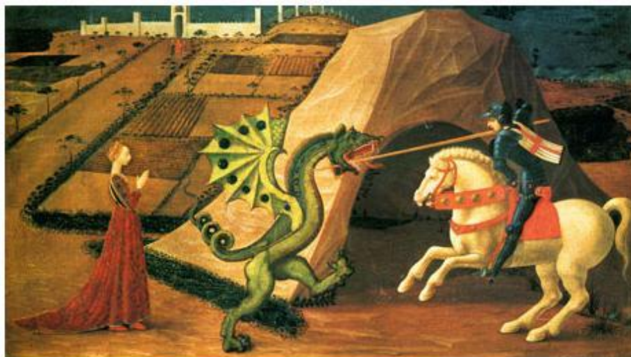
György és a sárkány (dárdás ábrázolás)