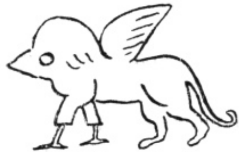
Sólyom fejű, oroszlán testű sárkány

A vallás fejlődése során a vízistenek képe más istenekével is összemosódott, ábrázolásukat több különféle állat egyes részeivel toldották meg. A sólyom, sas, gazella, oroszlán, kígyó, a hal, és a krokodil mind megtalálható valahol ezekben az istenségekben, s ezek mind a víz életet adó, és egyben romboló erejét személyesítik meg. A fenti állatokat azon tulajdonságaik szerint kombinálták, amelyiket az adott istenségnek hangsúlyozni akarták. A sárkány egyik legősibb ismert ábrázolása szintén Babilónia területéről, az ősi Sumér földről maradt fent. Ezen ábrázolás szerint a sárkány elől sólyom, hátul oroszlán testű állat. Ez a lény tekinthető a sárkány és a griffmadár közös őseinek, egyúttal a madárlábbal ábrázolt sárkányok is belőle származtathatók.