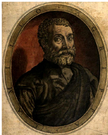
Ábra 1: Camillo Agrippa (Camillo Agrippa)

Camillo Agrippa a felvilágosodás korának egyik legjelentősebb vívómestere volt. Milánóban született, de Rómában élt és alkotott a 16-ik században (Mindschein, 2014). Új szemszögből közelítette meg a vívást, és annak oktatását, tudományos, geometriai alapokra helyezve azt. Jelentős hatása volt kora vívóművészetére, a rapír elterjedésére sőt még a modern, olimpiai vívásra is. Vívókönyve a Trattato di Scientia d'Arme nem tanítványok szűk körének, hanem a szélesebb publikumnak készült. A könyv így olyan népszerűsége tehetett szert, ami indokolta többszöri újra kiadását.