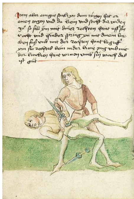
3. ábra: a Gladiatoria csoporthoz tartozó MS German Quarto 16 42r oldala 3